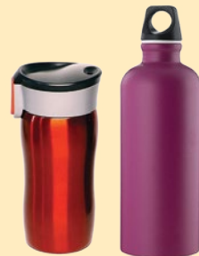
багаторазові гуртки та пляшки

Відвідайте веб-сайт Департаменту штату Washington, щоб дізнатися про альтернативи виробам із пінополістиролу.