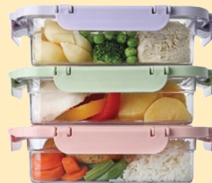
багаторазові контейнери для їжі на винос

Допоможіть своїм клієнтам захистити довкілля та скоротити кількість сміття. Заохочуйте використання багаторазових упаковок