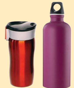
jarras y botellas reutilizables

Visite el sitio web de Ecology de WA para obtener información sobre las alternativas a los productos de poliestireno expandido.