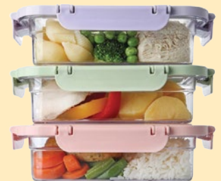
recipientes para llevar reutilizables