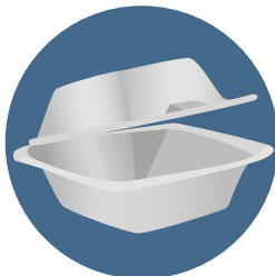
금지 조개껍데기 스타일 포장 용기